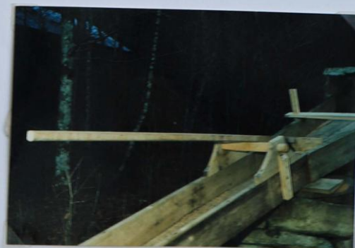
Vattenrännan vid Broborgs kvarn På Vallby nr 1-5 kvarnplats